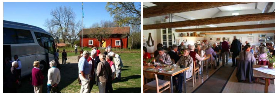
Förmiddagskaffe i Tolvmansgården

Vi åker genom den nya tunneln på Norrortsvägen och passerar under tre berg – Vaxmora-, Törnskogs- och Snuggtaskeberget. Kort därpå kommer vi in i den avsevärt kortare Löttingetunneln och svänger sedan av mot Täby kyrkby och Vallentuna. Vitsippor prickar backarna och plötsligt lyser vägkanten av tussilago.