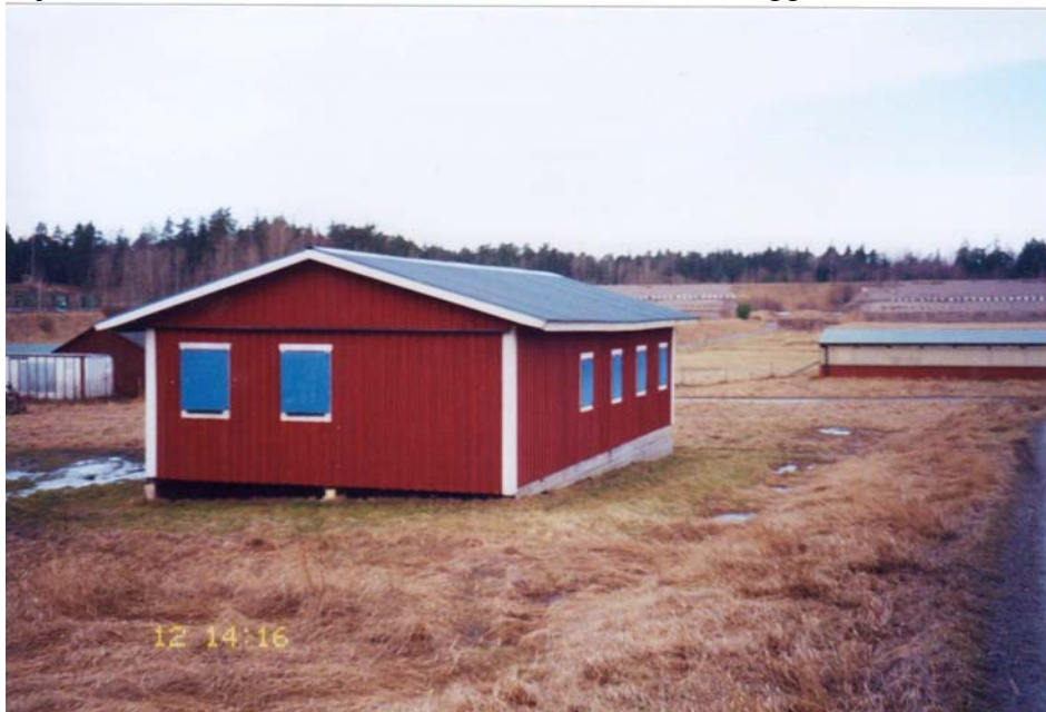
Paviljongen vid Järvabanen.

Åren gick och våra medlemmar var nöjda och hade geografiskt nära till skjutbanan. Då kom beskedet att Järvabanen skulle läggas ned.