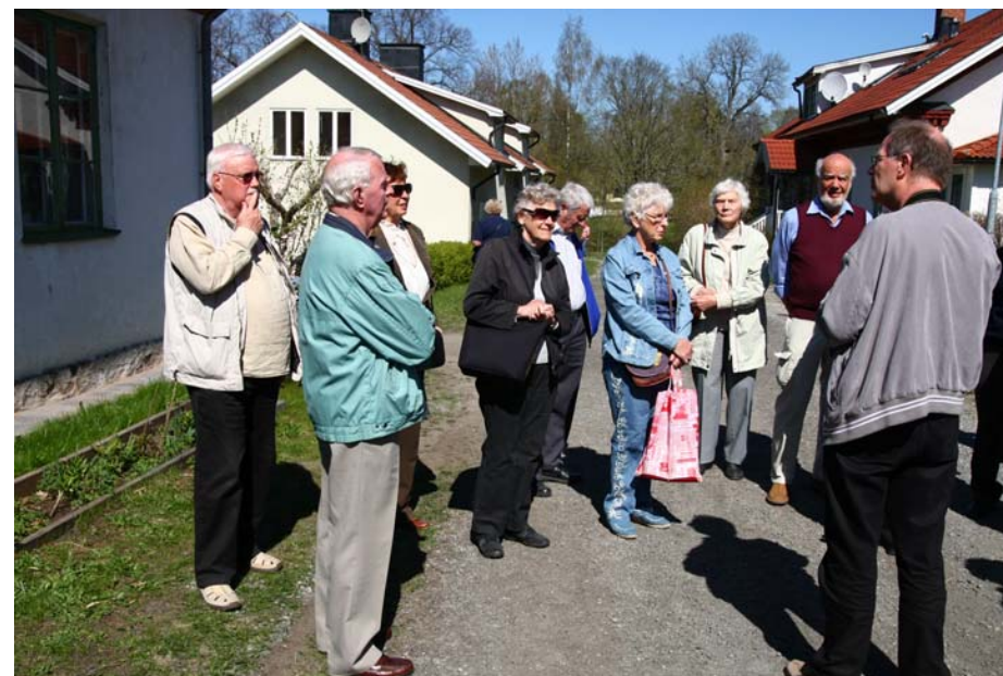
Bruksgatan i Skebobruk

Vallonerna var till sin bekännelse kalvinister och de startade skolor för barnen på bruket långt innan den svenska folkskolestadgan kom till. Undervisningen skedde på franska.