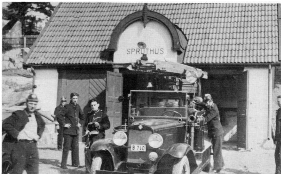
Solhems första brandbil, B 710

brandkåren larmades endast 2 gånger 1929, 1 gång 1931, 5 gånger 1932 och 9 gånger 1934. År 1983 gjorde Kista och Vällingby Brandstationer som i dag täcker i stort sett Solhems gamla område 499 resp 447 utryckningar - men det är ju skillnad på folkmängd fast det är samma geografiska yta.