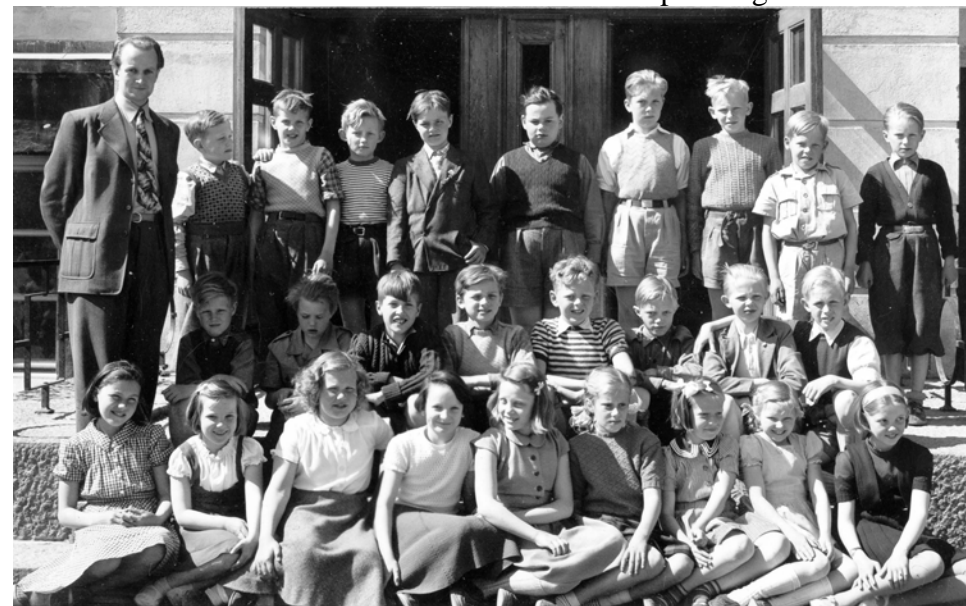
Solhemsskolan klass 3, höstterminen 1949.