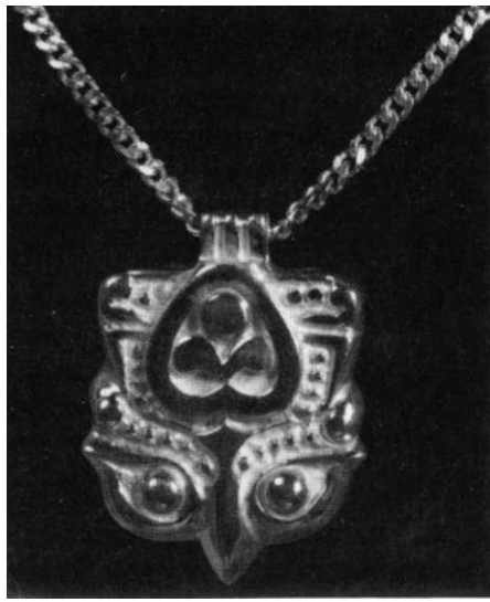
SPÅNG ASMYCKET tillverkas i silver