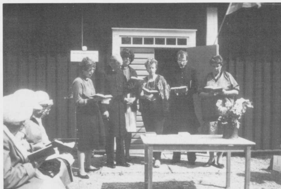
PRÄSTERNA I S:T TOMAS SJUNGER