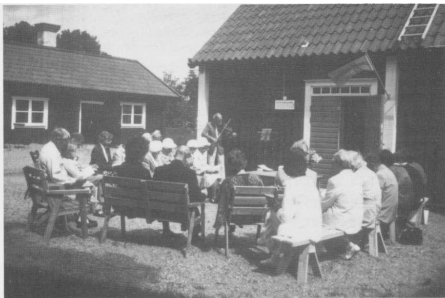
PSALMSÄNG OCH FIOL - Sommargudstjänst i Nälsta gård