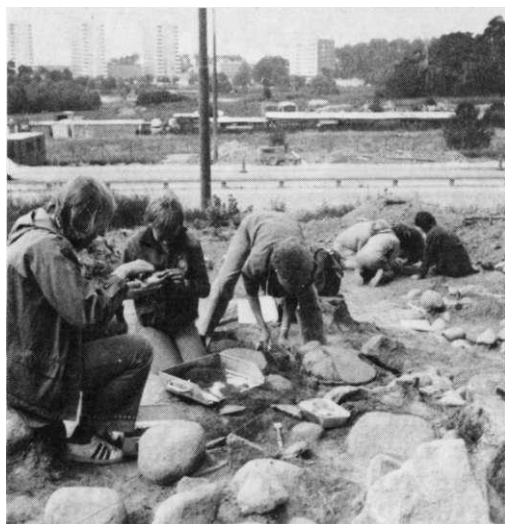
Arkeologikurs vid Ulriksdal, sommaren 1979

Om du vill veta mer om riks- och länsförbund, ring 08/42 27 48 eller skriv till Box 200 31, 104 60 Stockholm, eller varför inte titta in när du har vägarna förbi.