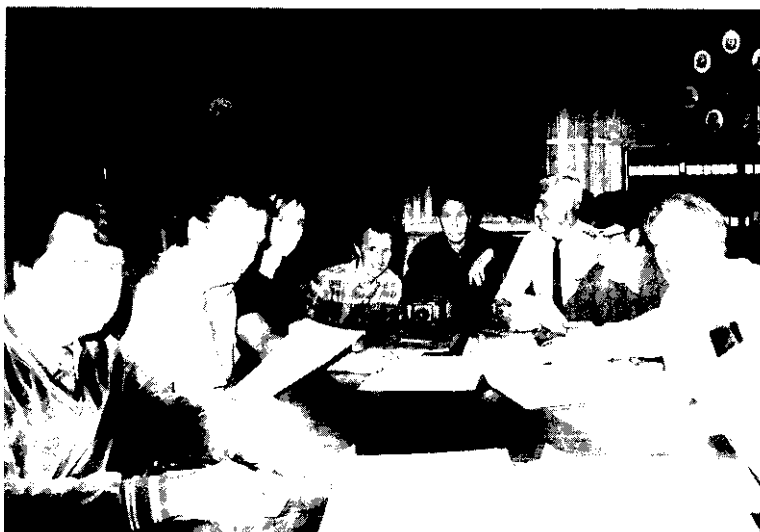
Läsning av gamla sockenstämmoprotokoll i Spånga församlingshus den 7 september 1981

från Spånga pågår varje måndag. 1600-talet är genomläst och renskrivet. Där ingår många sidor kyrkoräkenskaper. Vi har nu kommit in i 1700-talet och protokoll tenderar att bli mera intressanta. Antalet deltagare varierar från gång till gång och fler är välkomna att träna läsning av gamla handstilar. Kontaktpersoner: Lars Nahlbom, 760 37 27, Sixten Källberg, 36 41 09.