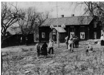
Utflykt till Åland, maj 1981