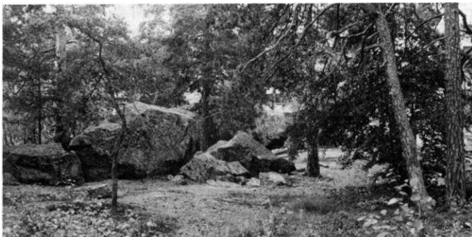
Tingsplatsen vid Noregatan-Bergengatan i Husby

Om det ovan förda resonemanget är riktigt ger oss runhällen vid Husby inte bara kunskap om några människor som levde i norra Spånga på 1000-talet, utan belyser också en viktig förändring av samhället och dess administration under förhistorisk tid.