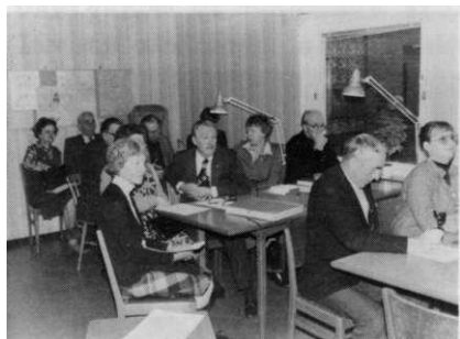
Studeibesök vid ortnamnsarkivet, december 1979