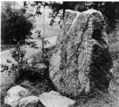
Runsten vid den gamla vägen mellan Husby och Akalla