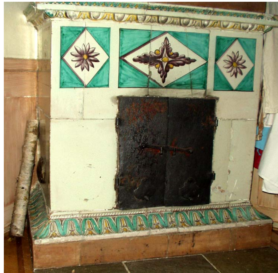
Detalj av kakelugn i arbetsrum.

Ytterligare en inredning har vi hämtat från samma fastighet som nyss nämnda kolonnkakelugn, och den utgörs av skulpterade kolonner och listverk samt i sepia målade dörröverstycken, sannolikt i Masreliez' skola (påminner starkt om entréinredningen i Hagapaviljongen) torde också vara utförd omkring sekelskiftet 1700-1800. Den är också signerad med ett inhugget S:t Georgskors, det s.k. frimurarkorset. Den är uppsatt i matsalen.