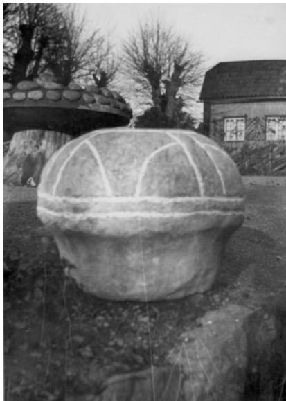
Smörasken på villovägar.

I våra dagar står nu invid inhägnaden en beskrivning av den strid som enligt dagens hävdaskildringar en gång pågick här. Gravar från folkvandringstiden, 400-800 e.Kr., var ofta försedda med stenar, men det är sällan dessa bevarats på plats till våra dagar. Så var också dessa borta, men återfanns på olika gårdar i trakten och återfördes 1926 då även ett nytt ekekors uppsattes på greve Bondes bekostnad. Inte långt härifrån har en ståtlig runsten haft sin ursprungliga plats. Dessvärre flyttades den till Hässelby slott på 1860-talet.