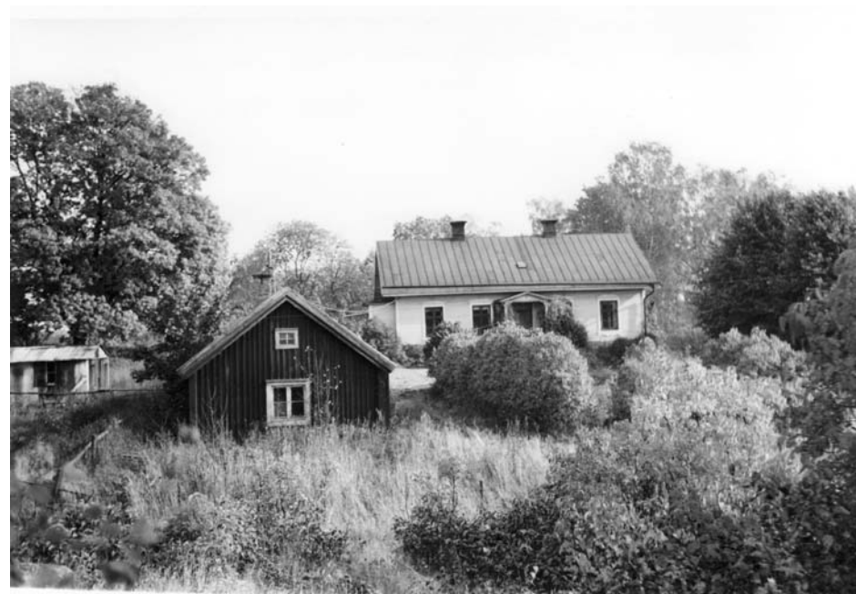
Lunda gård 1962.

Lundagårdsvägen slutar i en rondell, sedan är det parkväg genom området. På andra sidan järnvägsspåret (numera borttaget, red:s anm.) längre fram låg den ”Lunda gård” som gett namn åt vägen.