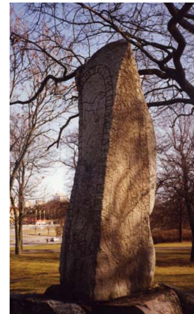
Runstenen vid Hässelby slott